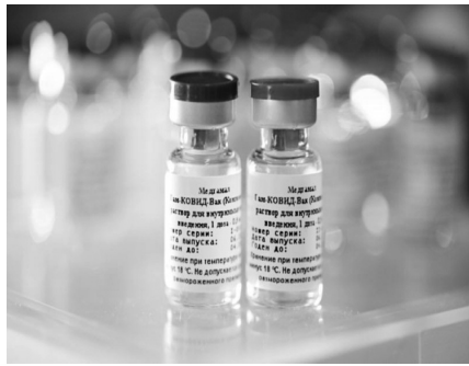
«les personnes âgées» et «les malades chroniques» font la première popula-

L'avion transportant les premières doses du vaccin anticovid-19 Sputnik V est arrivé au milieu de l'après-midi de ce vendredi à l'aéroport militaire de Boufarik (Blida). tandis que la campagne de vaccination sera lancée aujourd'hui samedi 30 janvier courant, a annoncé à Alger le ministre de la Communication et porte-parole du gouvernement, Ammar Belhimer. Blida, premier foyer de la pandémie, a indiqué le ministre, est symboliquement choisie comme point de lancement de la vaccination nationale, soulignant que